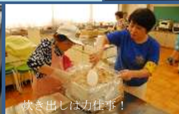
炊き出しは力仕事！