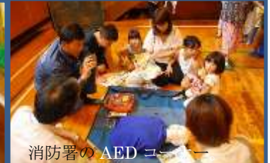
消防署のAEDコーナー