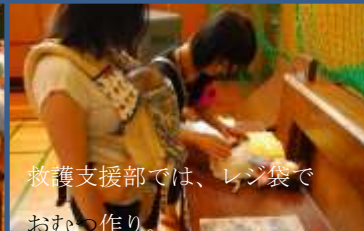
救護支援部では、レンジでおむっ作り。