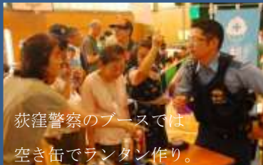
荻窪警察のブースでは空き缶でランタン作り。