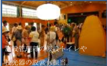
施設管理部の仮設トイレや投光器の設営も担当。