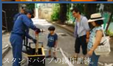
スタンドパイプの操作訓練。