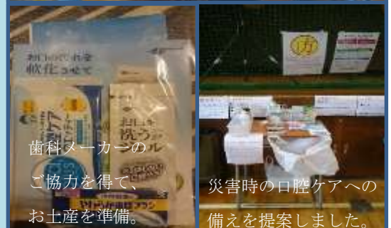
歯科メーカーのご協力を得て、お土産を準備。