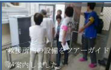
救援所内の設備をツアーガイドが案内しました。