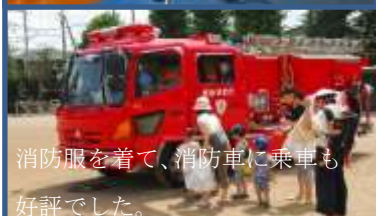
消防服を着て、消防車に乗車も好評でした。