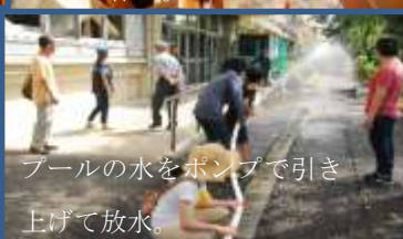
プールの水をポンプで引き上げて放水。