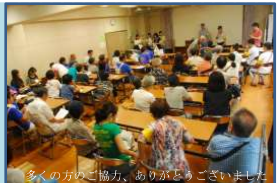
多くの方のご協力、ありがとうございました

アンケート回収 256 名のうち、約 6 割の方が訓練に初参加。保育園の協力があったことで、小さなお子さん連れのご家族も多く参加されました。アンケートからは「体験して理解でき、目からうろこでした」「日頃の防災意識の低さを感じた」「考えが甘かったと感じた」といった声が寄せられました。また「ベビーカーの出入りが難しい」「こんな活動を初めて知った」など、設備面での課題や広報活動の課題なども確認できました。