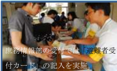
庶務情報部の受付では「避難者受付カード」の記入を実施。